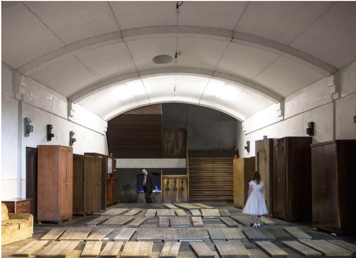
Abb.2 LA SONNAMBULA von Vincenzo Bellini, Regie und Dramaturgie: Jossi Wieler, Sergio Morabito; Bühne und Kostüme: Anna Viebrock, Bernd Uhlig fotografierte die Klavierhauptprobe am 16. Januar 2019.

Rätsel. Es ist schön, wenn man Dinge in einem Bühnenbild hat, die sich nicht erklären, dann ist es ja auch für das Publikum interessanter. Das ist dann Theater.