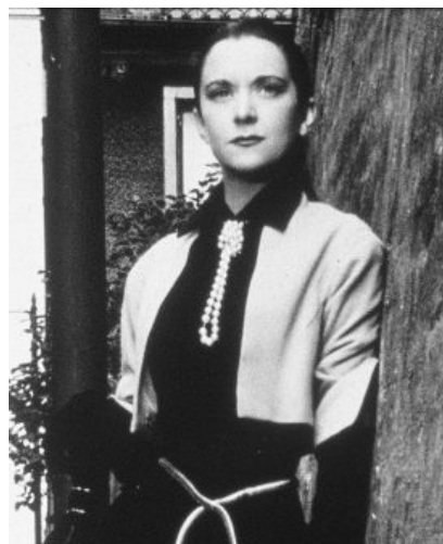
Abb. 6. María Casares in ORPHÉE, 1950, Regie: Jean Cocteau, Andre Paulve Film; Films du Palais Royal

Dann war LEAR an der Bayerischen Staatsoper in München. Der Bühnenraum ist dem oberen Stockwerk des Naturhistorischen Museums Basel nachempfunden und zum dritten Mal in veränderter Form wiederverwendet: nach den Stücken 20th CENTURY BLUES, 2000 am Theater Basel und BEKANN-